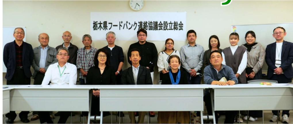
栃木県フードバンク連絡協議会設立総会

10/27、栃木県内12のフードバンクが参加する「栃木県フードバンク連絡協議会」の設立総会が開かれ、新組織が発足しました。