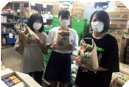
↑来るたびに友人を誘ってきてくれます！

今まで困ってる人はお金の支援だったり、福祉の支援だけだと思っていたので、驚きと同時に自分の無知さに恥ずかしくなりました。ですが、支援の幅広さを知れたのは過去の私がボランティアをやろうという挑戦の心があったからです。皆さんも新たな1歩を一緒に踏み出してみませんか？