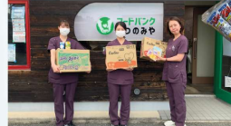
済生会宇都宮病院様