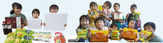
配布会のほか、子ども食堂や学童保育、県内の困窮家庭に渡しています