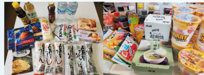
ドコモショップ宇都宮北店・上戸祭店様