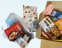
積水ハウス不動産様