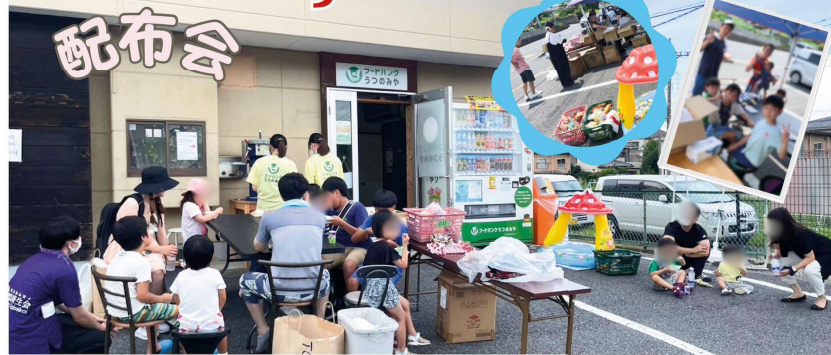
7/27(土)子育て世帯向けに食品配布会を実施しました。35度ぐえの真夏日の中、たくさんの人に食品を渡すことができました。一番人気は何といってもかき氷! 手作りのいちごシロップも好評でした。次は12月にやります! 何がでるかな~