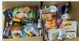
宇都宮中央病院様

いただいた食品で活動できています(^^)v 配布会も無事できました ありがとうございます 引き続きご支援をお願いします (スタッフ・ボランティア一同)