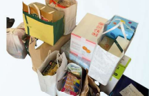
とちぎコープさずなBOX