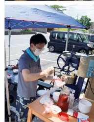
ショップはこのいちごから作りました