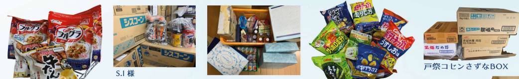
カルビーロジスティック様