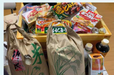
宇都宮市家庭婦人バレーボール連盟 バレーボール大会FD