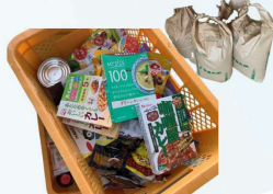
栃木県看護協会様